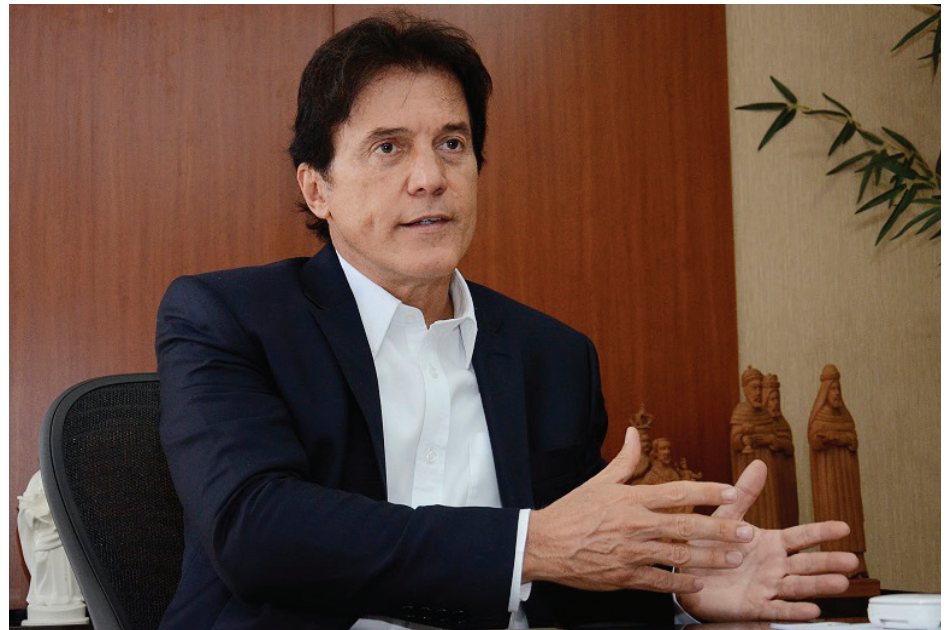
Diante da previsão do ministro, somente em dezembro de 2017 o estado seria contemplado com a chegada das águas

O governador aproveitou ainda para pedir ao presidente Michel Temer, que visitará o Ceará no próximo dia 8, que estenda a agenda até o Rio Grande do Norte para conhecer a realidade das inúmeras famílias vítimas da seca no estado. “São mais de 50 cidades dependendo de caminhão-pipa”, apontou. A transposição do Rio São Francisco (90% concluída) chegará ao estado, no final de 2017, pelo ramal do Apodi e deverá alimentar os rios Mossoró-Apodi e Piranhas-Açu.