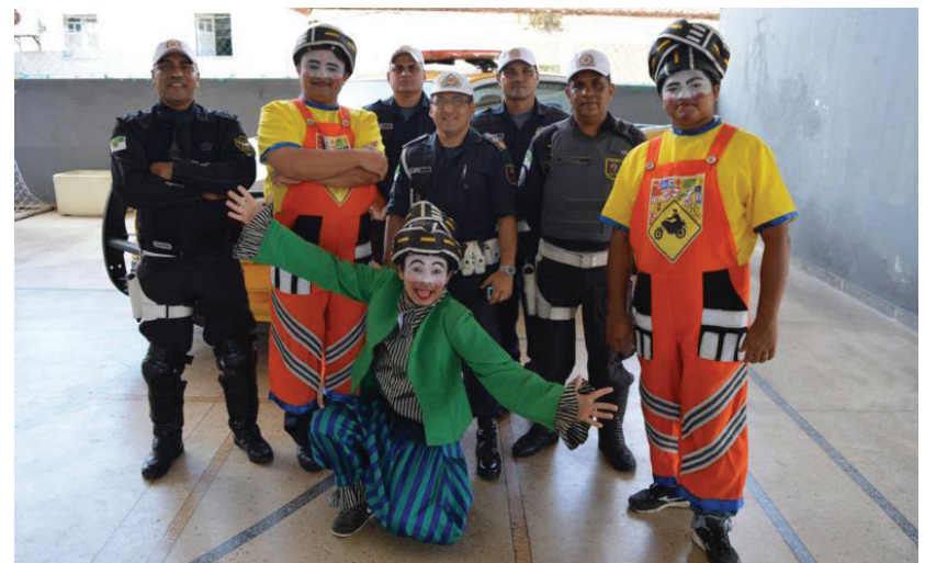
O projeto “Educação de Trânsito nas Escolas” criando no ano de 2011, atende crianças de 8 a 12 anos

Criado em 2011, na cidade de Caicó, o projeto “Educação de Trânsito nas Escolas” atende crianças de 8 a 12 anos que estudam em escolas de ensino fundamental com atividades educativas sobre trânsito. Nas escolas são ministradas palestra com base em uma cartilha contendo aulas teóricas e práticas.