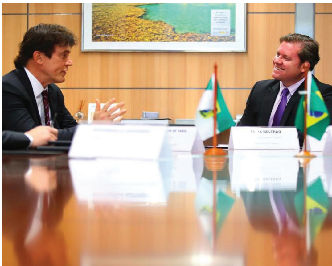
Entre os locais para obras estão o Centro de Convenções de Natal, do Museu da Rampa e a obra de revitalização do Forte dos Reis Magos

Para o governador, a reunião teve saldo positivo. “O ministro Beltrão sabe das nossas necessidades, sobretudo porque temos uma vocação turística muito forte e precisamos da conclusão dessas obras para garantir o nosso calendário de eventos, o que gera emprego e renda para o nosso estado”, disse.