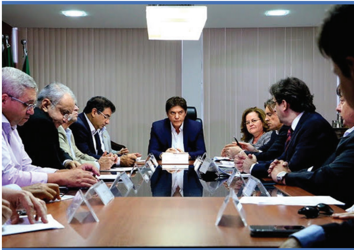
Os débitos de ICMS inscritos podem ser pagos à vista com desconto de até 100% nas multas. Micro e pequenas empresas, podem parcelar em até 72 vezes

O contribuinte poderá simular o parcelamento da dívida pelo site www.pge.rn.gov.br . Se o débito for menor que R$ 100 mil, o parcelamento pode ser feito pela internet. Dúvidas podem ser esclarecidas pelo telefone 3232-2736, pessoalmente na sede da Procuradoria Geral do Estado, na Avenida Afonso Pena, nº 1155, Tirol, Natal ou em um dos Núcleos Regionais.